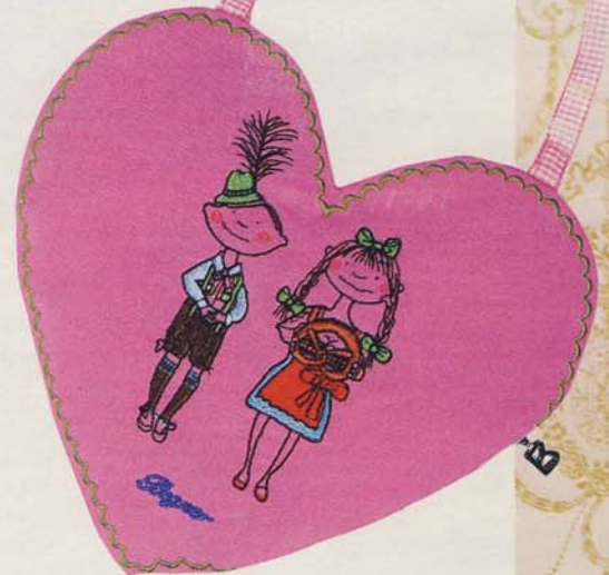
Ganz wichtig: a Tascher'l zum Umhängen! Gibt es bei Bogner , ca. 80 Euro, www.bognerhomeshopping.de