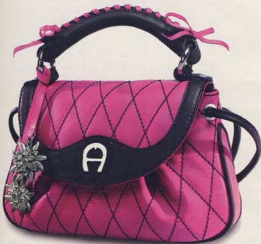
Ein echtes Münchner Kind! Das Luxus-Label Aigner hat nun eine limited Edition (350 Stück) mit Charity-Anteil auf den Markt gebracht, ca. 350 Euro