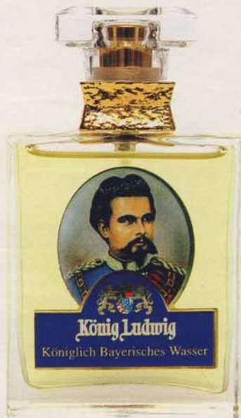
Und damit auch artgerecht geduftet wird im Bierzelt, gibt es das passende Duftwässerchen „König Ludwig Königlich Bayerisches Wasser“ der Münchner Hof-Parfümerie Brückner