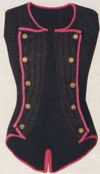
Jankerl, das auch nach dem O-Fest ein cooles It-Piece ist. Gibt es bei: www.mohrmann-market.de