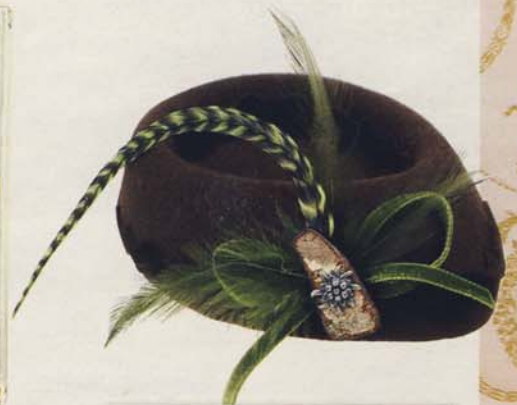
Geht nicht nur zur Leder-Hosen! Wer nur den kleinen, feinen Touch liebt, kann damit punkten. Schiffchen aus Filz von Salon Hüte & Accessoires , ca. 145 Euro