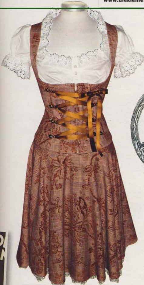
Individuell gefertigt und durchaus alltagstauglich zu kombinieren. Von CHRISTELundSINN , ca. 800 Euro