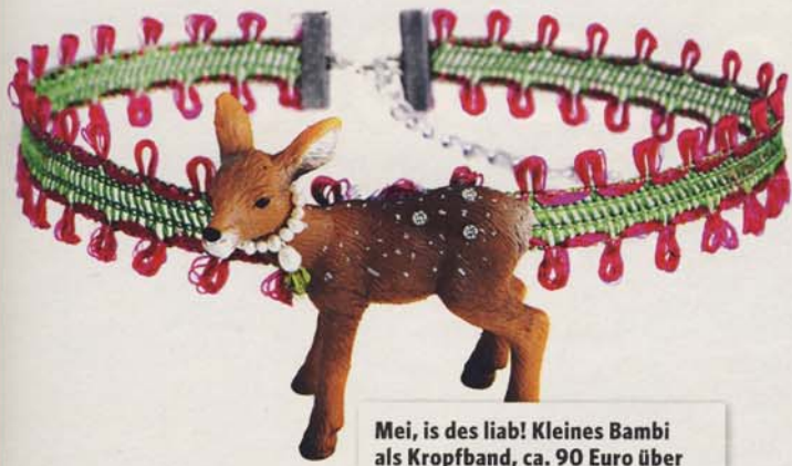
Mei, is des liab! Kleines Bambi als Kropfband, ca. 90 Euro über www.diekleinefirma.com