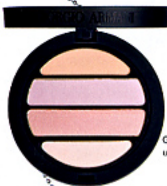
Giorgio Armani, um 45 Euro