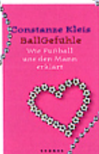
Krüger-Verlag, 13,90 Euro