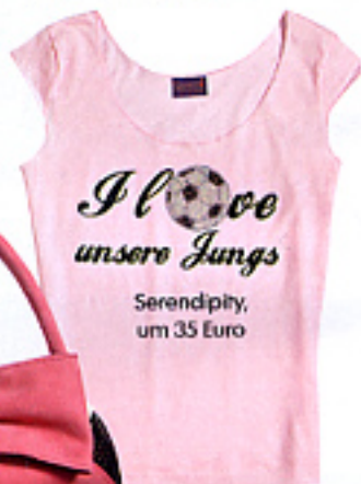
Serendipity, um 35 Euro