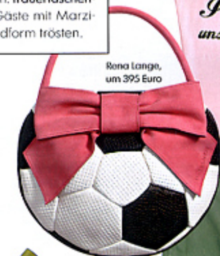
Rena Lange, um 395 Euro