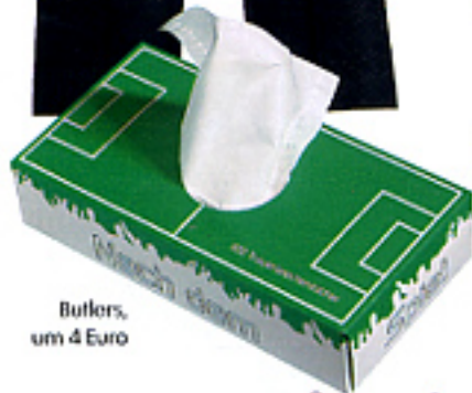
Butlers, um 4 Euro