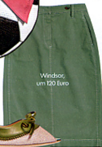
Windsor, um 120 Euro