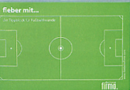
Tippscheine von die kleine firma, um 5 Euro