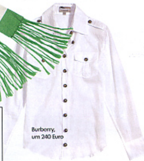
Burberry, um 240 Euro