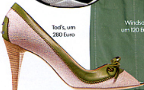
Tod's, um 280 Euro