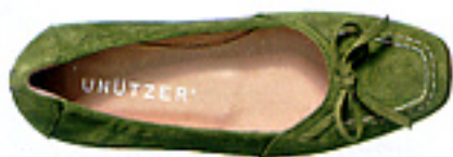
Unützer, um 270 Euro