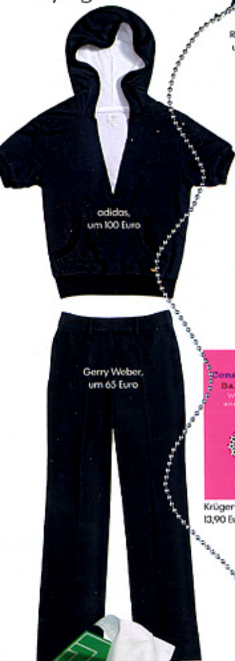
adidas, um 100 Euro